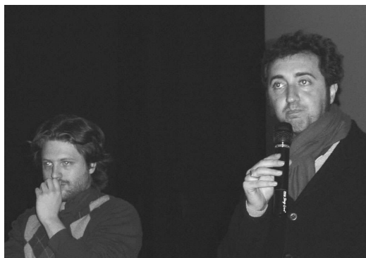
Curiosa espressione durante il dibattito al K2...